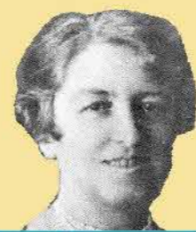
שם: חווה שפירא

שנות חיים: 1878-1943 שנת עליה: לא הגיעה לארץ ישראל מקום: אוקראינה ואוסטרו-הונגריה תפקיד מרכזי: סופרת