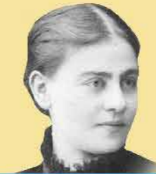
שם: אולגה חנקין - בלקינד

שנות חיים: 1852-1943 שנת עליה: 1886 מקום: האימפריה הרוסית תפקיד מרכזי: מילדת ופעילה ציונית