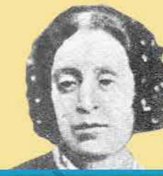
שם: רחל מורפורגו

שנות חיים: 1790-1871 שנת עליה: לא הגיעה לארץ מקום: איטליה תפקיד מרכזי: משוררת