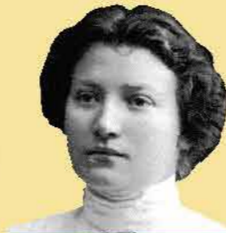
שם: שרה אהרונסון

שנות חיים: 1890-1917 שנת עליה: נולדה בארץ ישראל מקום: ארץ ישראל תפקיד מרכזי: מראשי נ"ל"