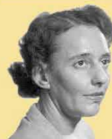
שם: לאה גולדברג

שנות חיים: 1911-1970 שנת עליה: 1935 מקום: פרוסיה המזרחית, ארץ ישראל תפקיד מרכזי: משוררת