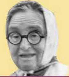
שם: יעל גורדון

שנות חיים: 1879-1921 שנת עליה: 1908 מקום: האימפריה הרוסית וארץ ישראל תפקיד מרכזי: פועלת ומחנכת