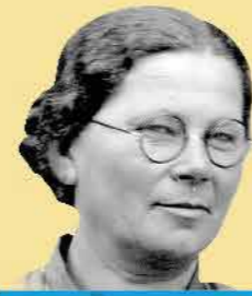
שם: עדה פישמן-מימון

שנות חיים: 1893-1973 שנת עליה: 1912 מקום: רומניה וארץ ישראל תפקיד מרכזי: מחנכת וחברת כנסת מטעם מפא"י