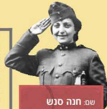
שם: חנה סנש

אינני זוכרת אם סיפרתי כבר שאני ציונית. מלה זו אומרת הרבה מאוד. אומר בקיצור מה משמעותה בשבילי: אני מרגישה שעכשיו אני יהודייה בעלת הכרה, ובכל מאודי. אני מתגאה ביהדותי ומטרת לי לעלות לארץ-ישראל ולהשתתף בבניינה. נקל להבין שרעיון זה לא נולד בן-לילה. לפני שלוש שנים, כאשר שמעתי בפעם הראשונה על הציונות, התנגדתי לה בכל כוחי. אבל המאורעות והתקופה בה אנו חיים קירבו אותי בינתיים לרעיון זה. כמה שמחה אני שהגעתי אליו. עכשיו חשה אני קרקע מתחת לרגלי ורואה לפניי מטרה אשר כדאי לעמול למענה. אתחיל ללמוד עברית. אבקר בחוג העוסק בכך – במלה אחת: רוצה אני לפעול במרץ. השתנית לגמרי, וכה טוב לי ככה. האמונה נחוצה מאוד לאדם, וחשוב שתהיה לו הרגשה שחיו אינם מיותרים, אינם חולפים לריק, שהוא ממלא תפקיד. את כל אלה נותנת לי הציונות. הכרתי הברורה היא כי זהו הפתרון היחיד של הבעיה היהודית, וכי המפעל הנהדר בארץ-ישראל הולך ומוקם על יסוד איתן. אני יודעת שיהיה קשה, אבל הכול כדאי