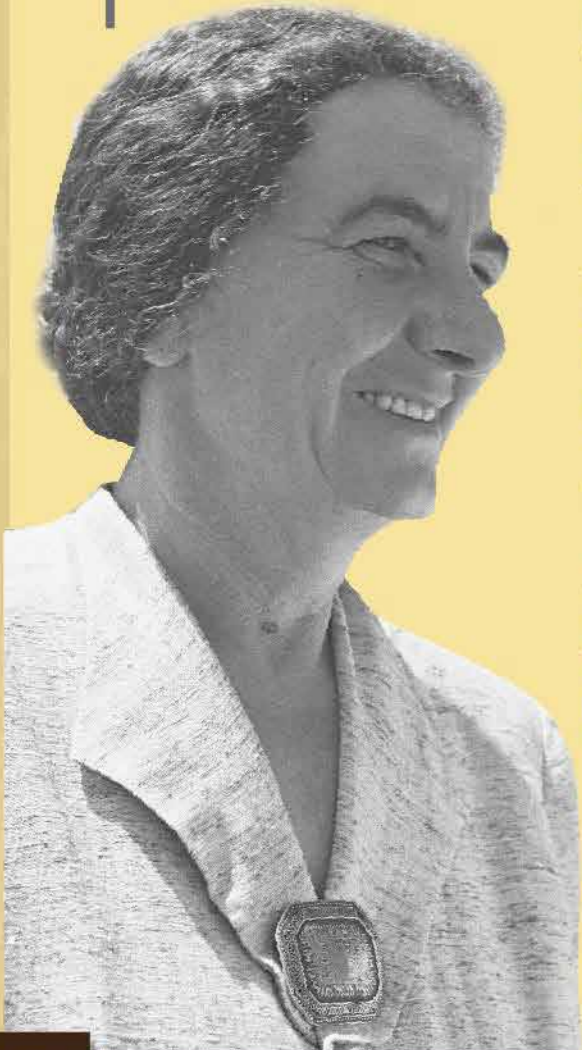
גולדה מאיר, חיי, עמ' 156-158

עד שחזרתי לארץ בחודש מרס אספתי חמישים מיליון דולר, שנמסרו מיד לרכש הסודי של ה'הגנה' באירופה. אבל מעולם לא רימיתי את עצמי - אף לא כאשר בשווי אמר לי בן גוריון, 'אחד הימים, כשיכתבו את ההיסטוריה יאמרו שהיתה אשה יהודיה שהשיגה את הכסף שאיפשר את הקמת המדינה'. תמיד ידעתי שהדולרים האלה ניתנו לא לי אלא לישראל.