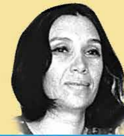
שם: נעמי שמר

שנות חיים: 1930-2004 שנת עליה: נולדה בארץ ישראל מקום: ארץ ישראל תפקיד מרכזי: משוררת