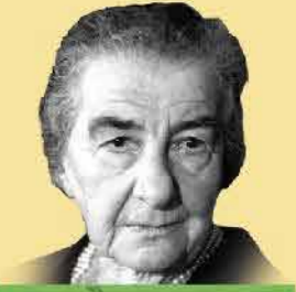
שם: גולדה מאיר

שנות חיים: 1898-1978 שנת עליה: 1921 מקום: אוקראינה וארץ ישראל תפקיד מרכזי: ראש ממשלת ישראל