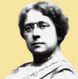
שם: הנרייטה סאלד

שנות חיים: 1860-1945 שנת עלייה: 1920 מקום: ארצות הברית וארץ ישראל תפקיד מרכזי: מייסדת ארגון 'הדסה'