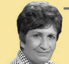
שם: שושנה ארבלי-אלמוזנינו

שנות חיים: 1926-2015 שנת עליה: 1947 מקום: עירק וארץ ישראל תפקיד מרכזי: חברת כנסת מטעם "המערך" ושרה בממשלת ישראל