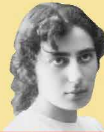
שם: רחל בלובשטיין

שנות חיים: 1890-1931 שנת עליה: 1909 מקום: רוסיה וארץ ישראל תפקיד מרכזי: משוררת