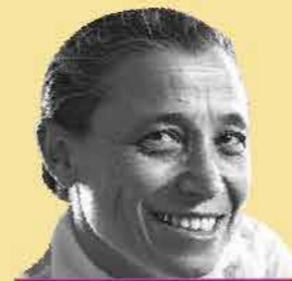
שם: אסתר רזיאל-נאור

שנות חיים: 1911-2002 שנת עליה: 1914 מקום: ירושלים, תל אביב תפקיד מרכזי: מורה, לוחמת באצ"ל וחברת כנסת מטעם "תנועת החרות"