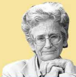
שם: רות גביזון

שנות חיים: 1945- שנת עליה: נולדה בארץ ישראל מקום: ארץ ישראל תפקיד מרכזי: כרוף למשפטים